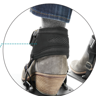
Zone de flexion brevetée pour un confort accru.

La nouvelle fermeture velcro est avec la Sangle connectée de grande qualité, de meilleure résistance aux plis. La languette en caoutchouc permet un ajustement simple.