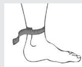
Tour de cheville