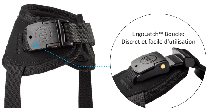
ErgoLatch™ Boucle: Discret et facile d'utilisation