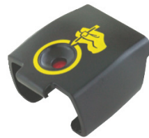
FS 025 C