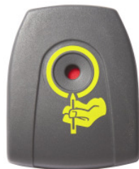
FS 019 C