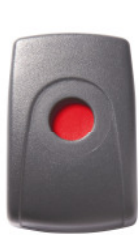
FS 018 D