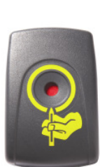
FS 018 C