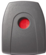
FS 019 D