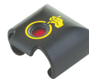
FS 029 C