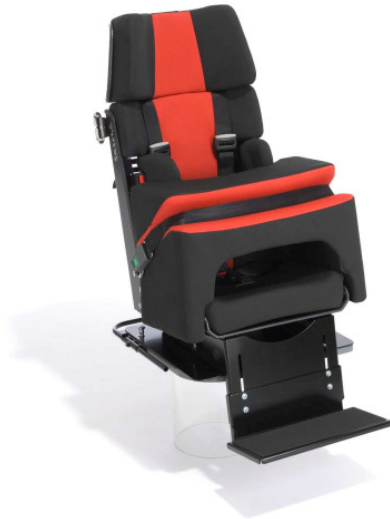
Abb. Grundmodell Sascha Grösse 2a, zusätzlich mit Schwenkvorrichtung, Fussbank und Seitenführungs- und Rumpfhaltelolster