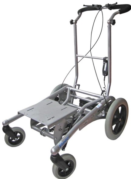
Kombiuntergestell Gr. 1, Grundmodell