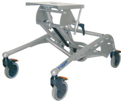
Zimmeruntergestell Gr. 1, Grundmodell