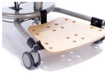
Ansteckbares Fussbrett für den Transfer oder die Positionierung der Füße