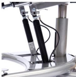
Die stabile Mittelsäule und die Abstützung der Kantelung garantieren die hohe Stabilität