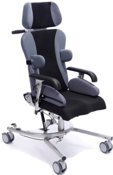
Abb. Grundmodell Madita Maxi zusätzlich mit Hüft- und Seitenpelotten