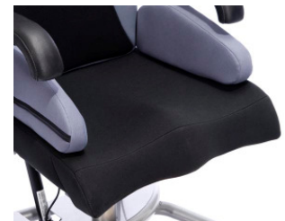
Die anatomische Sitzfläche bildet die Basis für eine gute Sitzposition