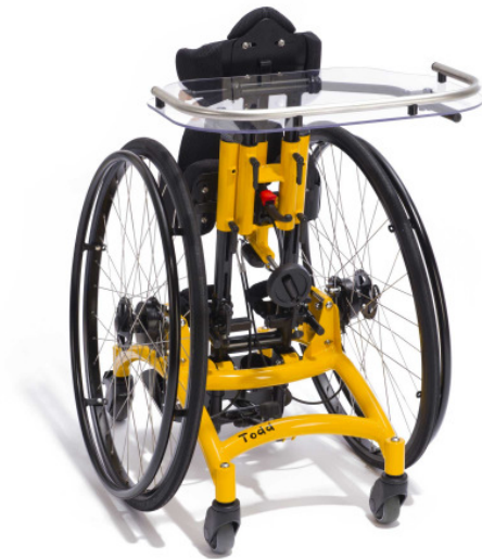
Abb. Grundmodell Todd Grösse 1, zusätzlich mit Brustpelotte mit Seitenführung, dreidimensional verstellbaren Kniepelotten mit einstellbaren Anlagebügeln, Fersenkanten und Therapietisch