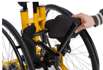
Kombinierte Spinen- & Beckenpelotten in der Tiefe, Höhe und Breite einstellbar