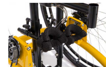
Kniepelotten einzeln, dreidimensional verstellbar mit einstellbaren Anlagebügeln