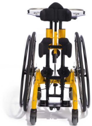
Brustpelottenhöhe und -breite, Gesässpelottenhöhe und dreidimensionale Verstellung der Kniepelotten in der Grundeinstellung