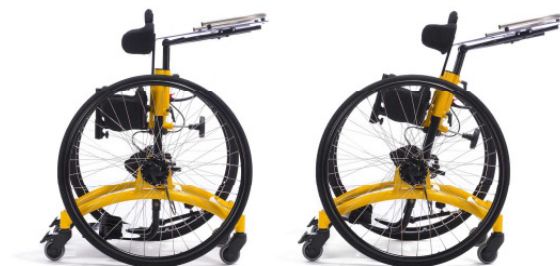
Winkelverstellung der Mittelsäule mechanisch von 0 - 15°