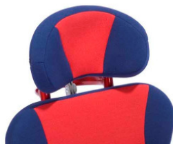
Unterschiedliche Kopfstützen zur Optimierung der Stützfunktion erhältlich