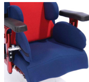
Durch die Hüftpelotten ist die Regulierung der Sitzbreite und die Einstellung einer abduzierten Sitzposition möglich