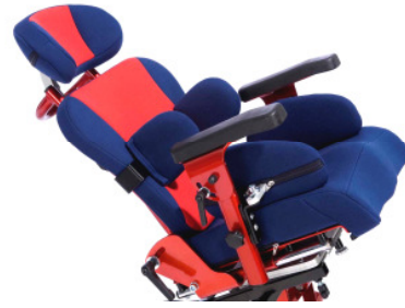
Sofie ist für die Kantelung auf Untergestellen geeignet