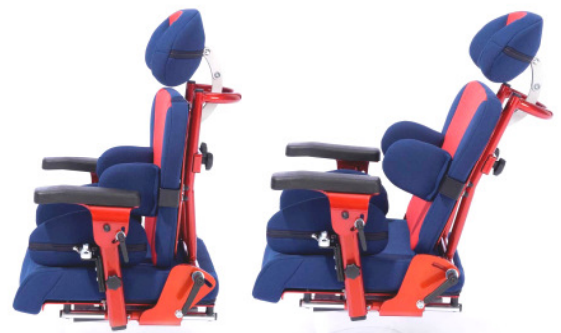
Winkel- und höhenverstellbarer Rücken