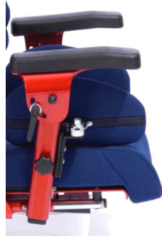
Die Armlehnen sind in der Höhe und im Winkel verstellbar