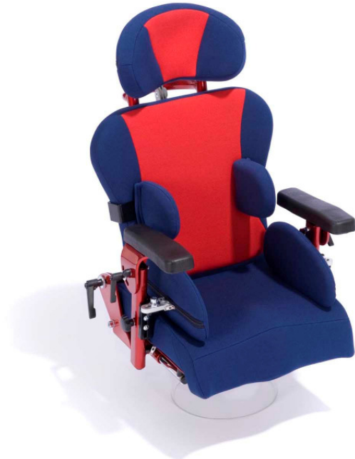
Abb. Grundmodell Sofie Grösse 1, zusätzlich mit Kopfstütze Muschelform, Rückenrohre ohne Schiebegriff, Hüft- und Seitenpelotten sowie anatomischer Sitzfläche