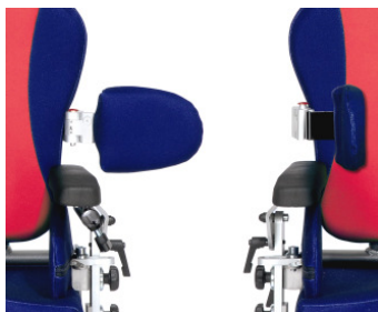
Die abklappbaren Seitenpelotten bieten eine körpernahe Einstellung und erleichtern das Hereinsetzen des Kindes in das Sitzsystem